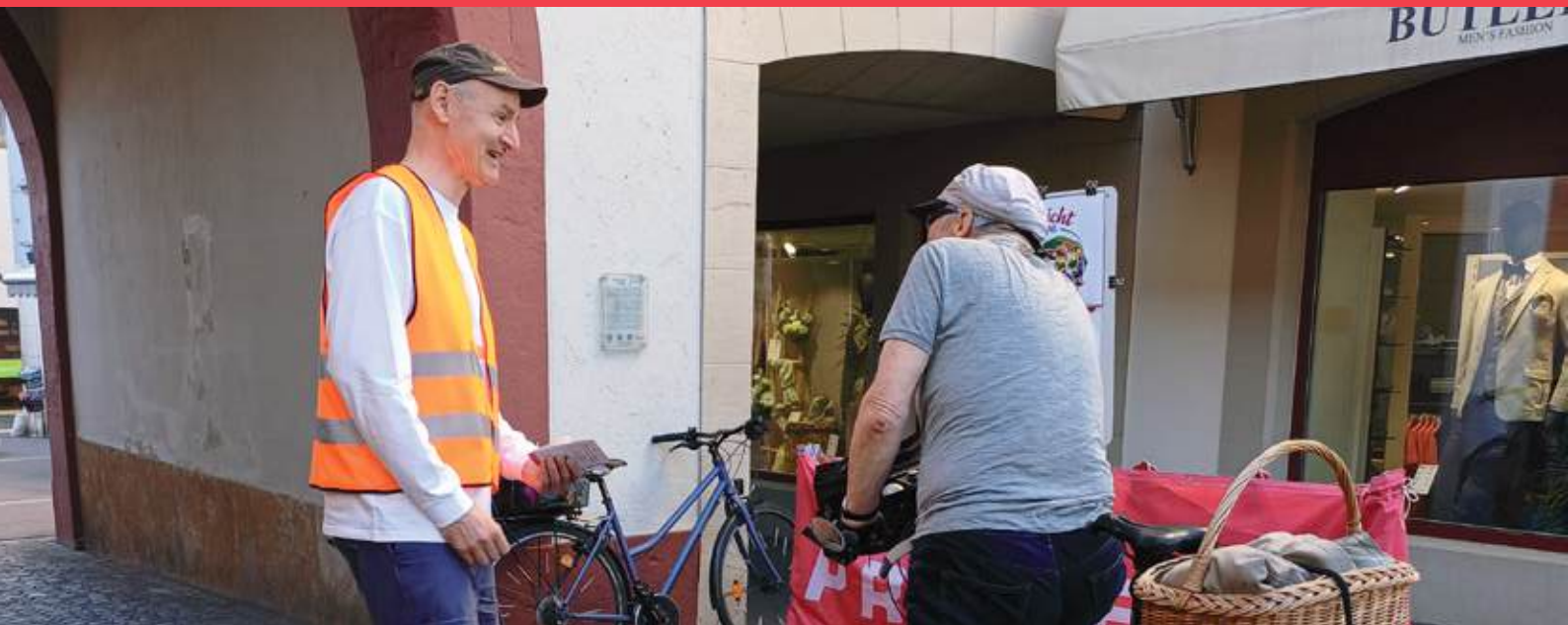
Pro Velo Liestal suchte im April das Gespräch mit den Velofahrenden im Stedtli