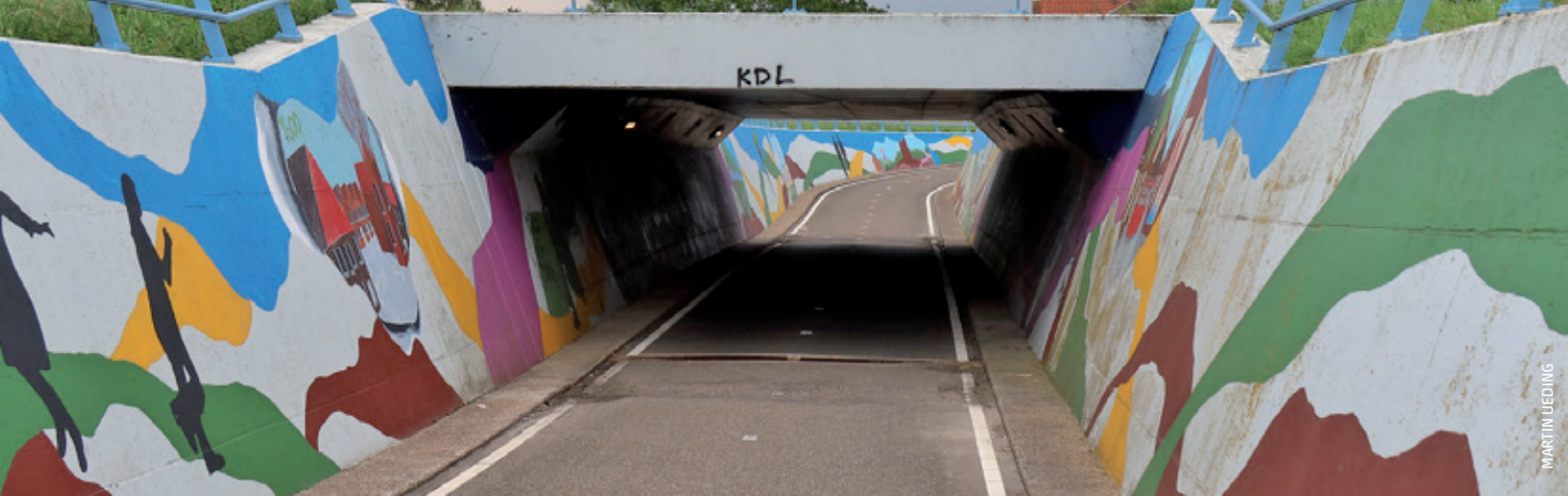
So geht Vorzugsroute: Niederländische Kreiselunterführung in Oostburg