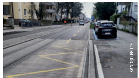
Haltestelle Zwinglihaus. Ein Beispiel, wie mit wenig Aufwand die Sicherheit verbessert werden kann