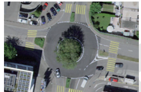
Nicht velogerecht und gefährlich: Kägenkreisel in Reinach