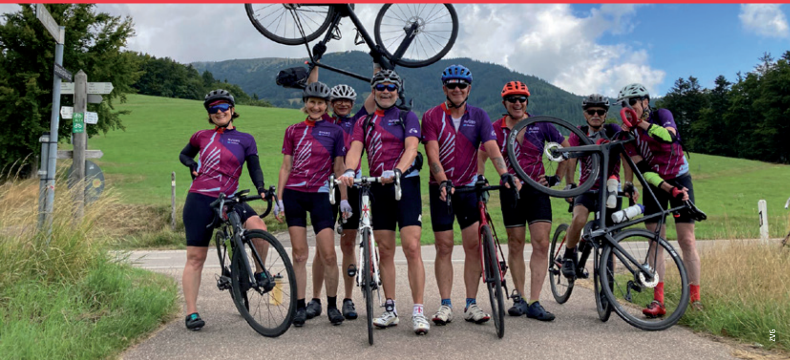
Die Rennvelogruppe auf hügeliger Ausfahrt