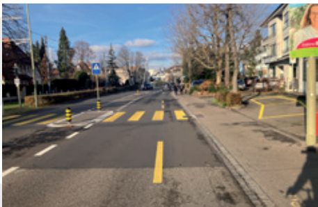
Diese zuvor sehr heikle Stelle in Reinach hat der Kanton gut saniert