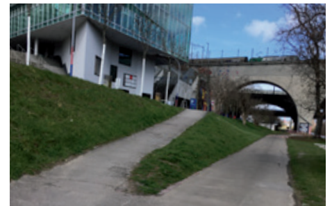
Dieser Teil des Wegs ist bis zum Trottoir der Birsstrasse legal befahrbar

Wir haben im letzten Veloblatt über die unglaublichen Verzögerungen beim Projekt Birsuferweg unter der Birsbrücke beim St. Jakob berichtet. In der Zwischenzeit haben uns die aktuell Zuständigen im persönlichen Gespräch informiert. Die aktuelle, erneute Verzögerung wird von den Vertreter:innen des Kantons bedauert. Ganz klar wurde uns der Grund für die Verzögerungen allerdings nicht. Möglicherweise fürchtete man Einsparungen von Naturschutzverbände – dann bliebe unklar, warum mit diesen nicht schon lange das Gespräch gesucht wurde. Der für Bauten im Gewässerraum nötige Nachweis der «Standortgebundenheit» sei jedenfalls klar gegeben. Man müsse nun aber noch schriftlich begründen (!), die Umsetzung solle dann im Herbst 2028 stattfinden ... Übrigens: Das Fahren unter der Brücke sei (zumindest auf Basler Seite) erlaubt, gebüst werden könnte nur auf dem Trottoir der Birsstrasse.