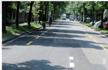
So wie hier zwischen Bundesplatz und Bernerring sollte es bald in der ganzen Neubadstrasse aussehen