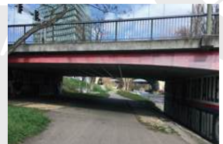
Schon immer beliebt und seit sechs Jahren sogar geteert: Die sichere, aber immer noch verbotene Veloverbindung entlang der Birs