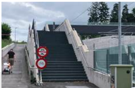
Die Rampe und Brücke der Schwieri-Passerelle sollten für den Veloverkehr freigegeben werden

Fast ein Jahr lang mussten sich Liestalerinnen und Velopendler gedulden, nun ist Mitte Oktober der Schwieristeg entlang der Geleise endlich zur Benützung freigegeben worden – zehn Monate nach der baulichen Fertigstellung. Grund für die monatelange Sperre war ein Rechtsstreit mit einer Anlagestiftung, die für ihre angrenzenden Immobilien einen besseren Sichtschutz wollte. Nach neu aufgenommenen Verhandlungen konnte sich die Stadt mit der Eigentümerin aussergerichtlich einigen. Die Einigung sieht vor, dass der Schwieristeg für die Bevölkerung geöffnet werden kann, sobald eine Sichtschutzfolie am Steg angebracht wird. Zusätzlich werden bis im Frühjahr zwischen Steg und Liegenschaft Bäume gepflanzt. Leider immer noch für den Veloverkehr gesperrt ist die Schwieri-Passerelle zwischen Gartenstrasse und Wasserturmplatz. Vor dem Umbau des Bahnhofs konnten Velofahrende in diesem Bereich die Geleise ebenerdig queren. Die neue Passerelle ist im Vergleich zur alten viel weniger steil und wäre problemlos für Velos befahrbar. Und allfällige Konflikte mit dem Fussverkehr könnten problemlos entschärft werden.