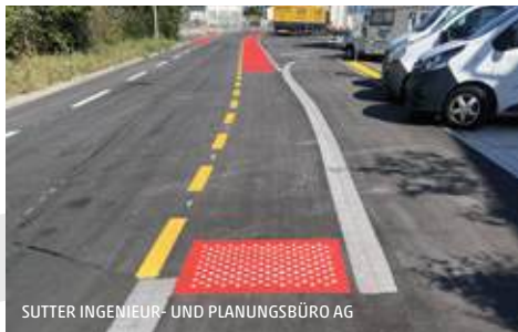
SUTTER INGENIEUR- UND PLANUNGSBÜRO AG

Die enge Zusammenarbeit mit VCS und Pro Velo hat sich gelohnt. Das für den Neubau der östlichen Hardstrasse zuständige Büro ist einen noch viel zu seltenen Weg gegangen und hat den VCS und Pro Velo frühzeitig in die Strassengestaltung miteinbezogen. Neben einer möglichst abgetrennten Verkehrsführung konnten wir so einen Rampentyp in Spiel bringen, der zuvor vom Kanton Solothurn in Zusammenarbeit mit Behinderten- und Veloverbänden entwickelt und getestet worden war. Die Konstruktion bringt zwei Anliegen unter einen Hut: Eine gut wahrnehmbare Führung für Sehbehinderte bei gleichzeitig gutem Fahrkomfort für Velofahrende. Aktuell spricht nichts dagegen, dass dies die zukünftige Standardlösung für solche Rampen wird.