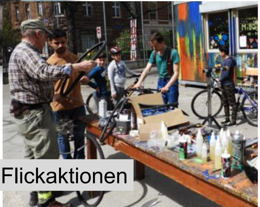
Putz- und Flickaktionen